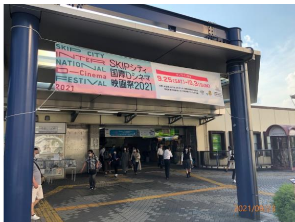
川口駅前の横断幕