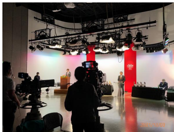
授賞式ライブ配信スタジオ